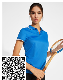
TAMIL WOMAN PO0409