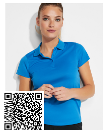
MONZHA WOMAN PO0410