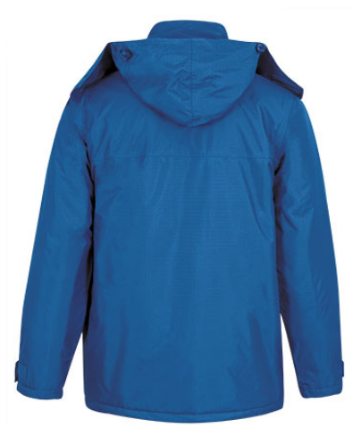
Vista parte trasera de la prenda (espalda)